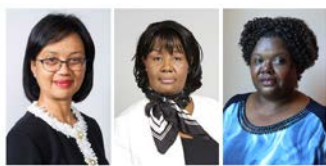
Gender was misidentified in 35 percent of darker-skinned females in a set of 271 photos.

Předsudky a jejich reprodukce prostřednictvím technologií, včetně umělé inteligence, nejsou úplnou novinkou. Data vládnu našemu světu. A pokud máte v datovém souboru vyšší množství osob s určitými znaky, ovlivní to schopnost učit se rozpoznání jedinců dané skupiny. Tyto systémy přitom teprve nacházejí své využití. Testuje se například zaměřování produktů na sociálních sítích prostřednictvím profilové fotografie, experimentuje se s automatizovanými rozhodnutími ohledně finančních částek za produkty, pronájem a půjčování. Přitom tyto systémy zatím nepodléhají žádné regulaci, která by předsudky napravovala. Zkušenost s tím, že ji v počítačové laboratoři jako Afro-Američanku nerozeznával program, se kterým za svých studií pracovala, vedl Joy Buolamwini z MIT k tomu, aby podnikla hlubší výzkum tohoto fenoménu. Podrobnosti o jejím výzkumu najdete v článku v na webu nytimes.com .